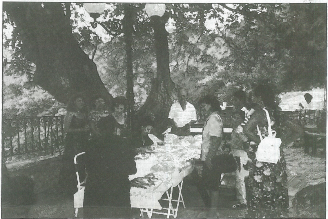
Φωτογραφία από το διαγωνισμό πίτας και ζυμωτού ψωμιού. Διακρίνονται μέλη του Συλλόγου να παραλαμβάνουν πίττες και ζυμωτό ψωμί κάτω από τον πλάτανο στο «ΠΑΥΣΙΛΥΠΟ» της Αγίας Παρασκευής. Υπαίθρια ομορφιά, τάξη και άριστη ποιότητα.

Οι πολιτιστικές εκδηλώσεις, που οργανώνονται από το Σύλλογό μας κάθε χρόνο στο χωριό μας περιλαμβάνουν μεγάλη ποικιλία εκδηλώσεων, τις παρακολουθούν όλοι οι απανταχού συγχωριανοί μας με τους φίλους τους και διακρίνονται για τη σοβαρότητα και την πανελλήνια πρωτοτυπία τους.