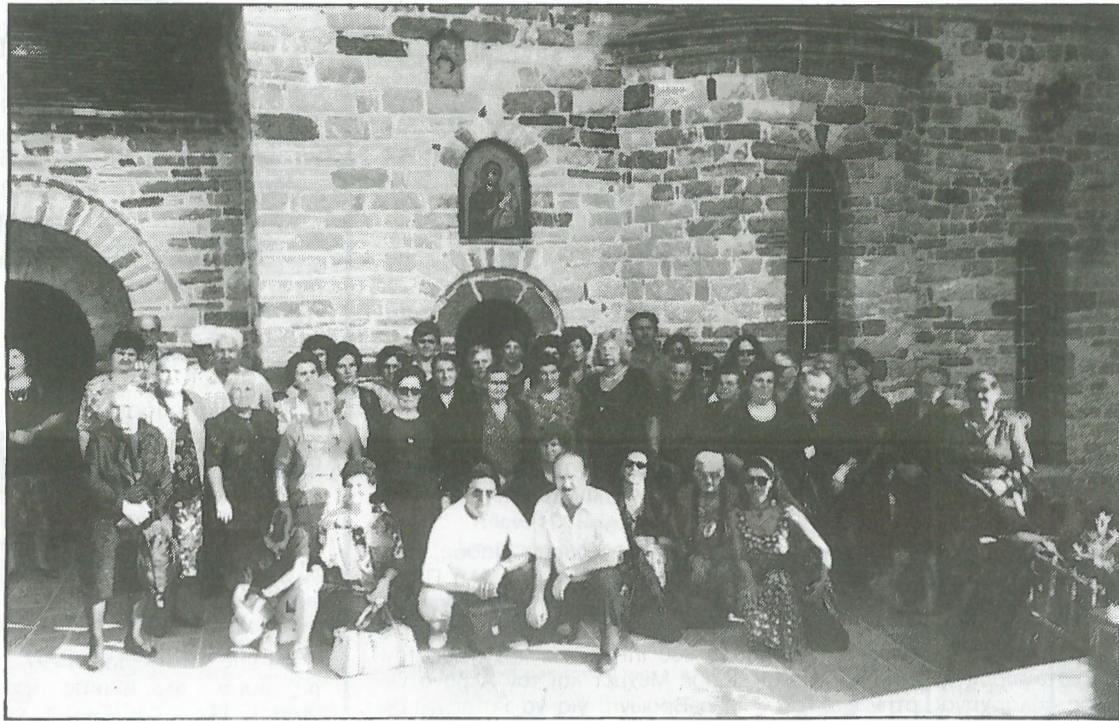
Φωτογραφία από την εκδρομή - προσκύνημα στην Παναγία την Προυσιώτισσα.

Ευχαριστώ Σε, Άχραντη πανάμωμε Κυρά. Το δάκρυ μου τον στέγνωσες. Τον πόνο μου τον ένωσες κι έγινεσ στη φουρτούνα μου λιμάνι απανεμιάς. Μέσ' στην πανάγια σου αγκαλιά, σαν μάνα όλους μάζεψε. Όπως παλιά το Έθνος μας και πάλι Συ προστάτεψε, Ανατολίτισσα κυρά, της Ρούμελης Αρχόντισσα, ω Παναγιά Προυσιώτισσα!»